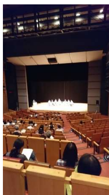
在宅医療相談室と医師会と共催 市民向け講座 第一部 上映会 ピア～まちをつなぐもの～