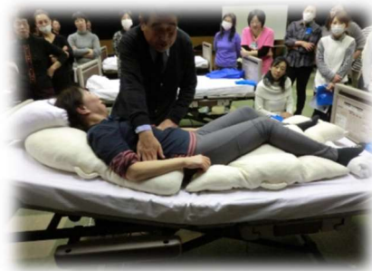
隙間を埋めてもらうと緩むわ～