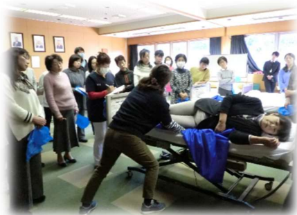
持ち上げない介護