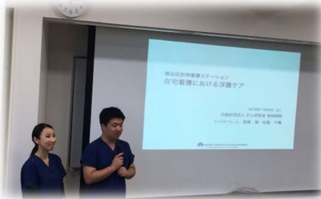
リンパ浮腫ケア研修会 講義風景↓