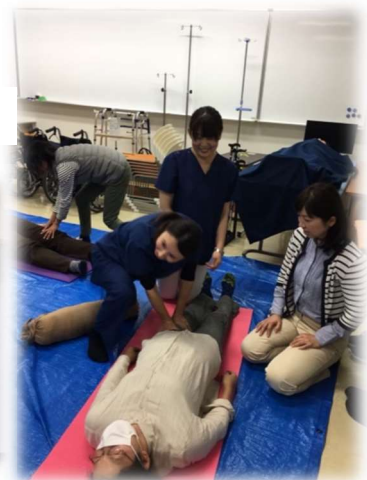
↑リンパマッサージ体験中