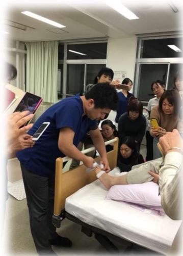
弾性包帯を巻いている↑